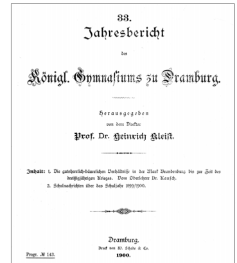
Titelblatt des Jahresberichtes des Königl. Gymnasiums von Dramburg, 1900